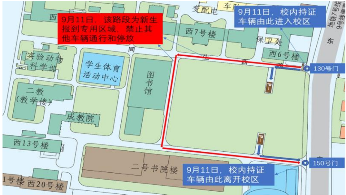
附图 3：9 月 11 日枫林校区交通管制示意图